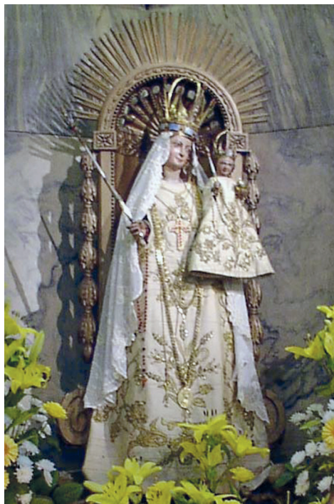
Cudowna figura w Katedrze w Akwizgranie

Chrystus, Pan chce wkroczyć i rozświecić swoje światło nad Europą przez modlitwę do Jego Matki, Patronki chrześcijańskiego Zachodu